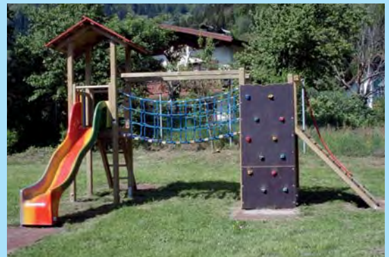
Spatz 004 mit Kletterwand und Rampe

Geräteabmessung: 534x431x360cm Fallschutz: Rasen, Fallschutzplatten, Kies, Rindenmulch, Sand, Hackschnitzel Fundamente: 8 Stk. 400/400/400 mm 3 Stk. 600/400/400 mm